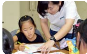
お姉さんに国語を教えてくださいました!

もちろんお勉強もしましたよ!算数の解き方や漢字を教えてください、楽しい2日間を過ごしました。また大学生は「小学生の元気な姿と笑顔に、たくさんのパワーをもらいました」と話していました。