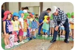
コマ回し上手だね!