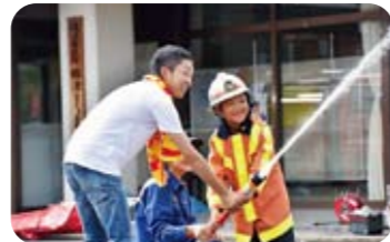
お兄さんは消防団員?!