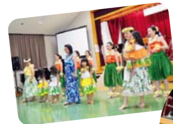
パイナップル?アップル?