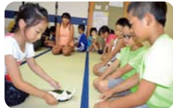
茶道体験 抹茶デビューは苦かった