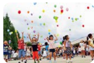
行ってらっしゃ〜い

お手玉やコマ回し等の昔の遊びを習ったり、幼稚園の園庭からは色とりどりの風船250個に手紙をつけて飛ばしました。