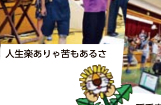
人生楽ありゃ苦もあるさ