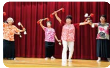
午後の演芸 銭太鼓