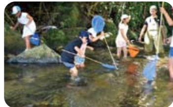
川で生きもの調べと水質検査