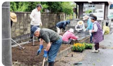
神戸 耕して肥料をまいて