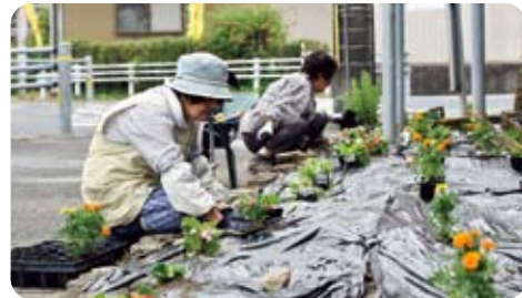
下小里交差点 二人で花のお世話大変だよ

梅雨が明ける頃には、1,260本のマリーゴールド・サルビア・ペゴニアが街のいたるところに咲き、心を和ませてくれることでしょう。