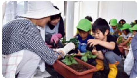
幼児園 根っこを傷めないようにそーっと