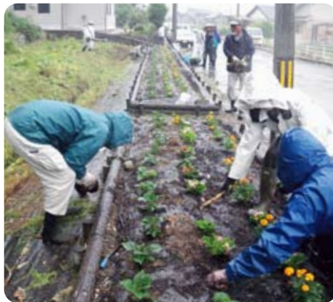
ひざし前 雨の中合羽を着て