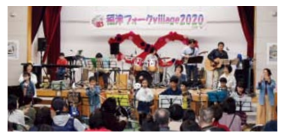
新型コロナウイルスの感染状況によっては変更になる場合があります。

昨年は新型コロナウイルス感染症対策のため開催できませんでしたが、徐々に練習を再開しました。まだまだ油断できない状況ですが、感染対策を講じながら2回公演で開催します。以前と比べ縮小したフォークvillageになりますが、メンバーも皆さんに聴いていただけることを楽しみにしています。 ◆日 時：令和4年2月6日(日) ※新型コロナウイルス感染症を鑑み6日だけの開催となります。 ①午前の部(平成世代) 10時~11時30分 ②午後の部(昭和世代) 13時~14時30分 ◆入場無料：整理券が必要です。①②どちらかをお選びください。整理券にお名前、電話番号をご記入のうえご来場ください。お持ちでない方は入場できません。※整理券は1月12日(水)から公民館窓口で配布します。 ◆定 員：1公演50名 ◆場 所：稲津公民館 多目的ホール ◆主 催：稲津フォーク村実行委員会・稲津まちづくり・稲津公民館 ◆問合せ：稲津公民館 ☎68-3201